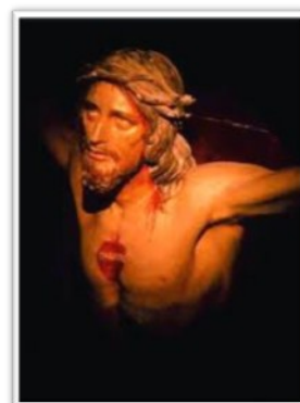
Crocefisso dell'Amore Misericordioso, Collevaleza